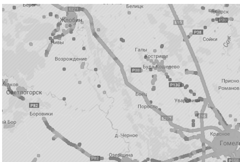
Рис. 1. Доступность сети мобильной связи

Как можно видеть (рис. 1), доступность сети мобильной связи на обоих участках дорог различная. На трассе Гомель–Жлобин не должно возникнуть проблем с определением приблизительной координаты. На трассе Гомель–Светлогорск, теоретически, из-за плохого уровня сигнала погрешность определения координаты будет хуже, чем на трассе Гомель–Жлобин.