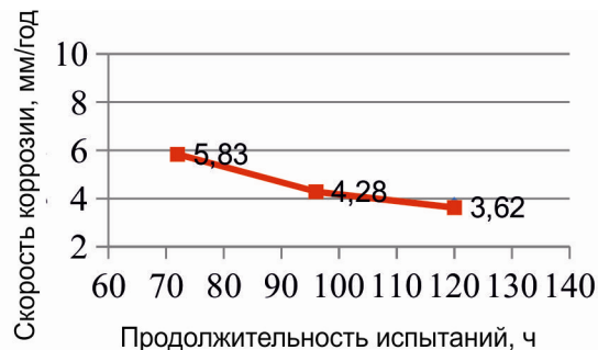
Рис. 3. Изменение скорости коррозии во времени при содержании растворенного сероводорода в модельной среде ~10 мг/л

По результатам проведенных исследований сформулированы следующие выводы: