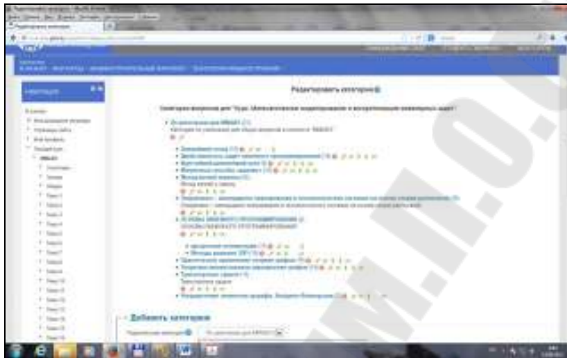
Рис. 1. Добавление и редактирование категории вопросов

При разработке тестов необходимо первоначально создать банк вопросов, предварительно разделить их на категории (рис. 1). Разделение вопросов по категориям дает возможность дополнять их новыми вопросами, а также создавать разные варианты тестов.