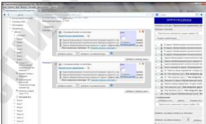
Рис. 2. Пример заполнения теста случайными вопросами

Практически все тесты созданы с несколькими попытками, которые оцениваются автоматически, со случайными вопросами, выбирающимися из банка вопросов (рис. 2). На каждый тест задано ограничение времени.