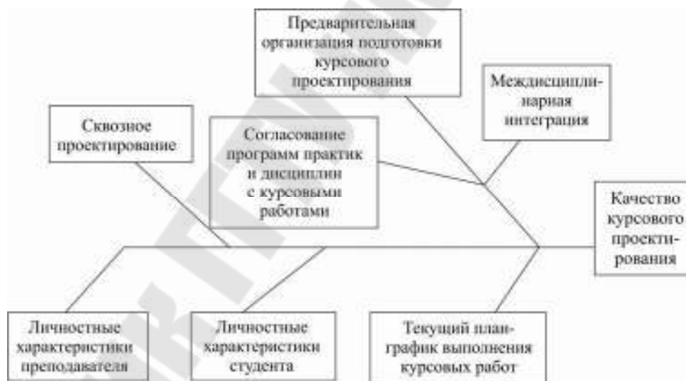
Рис. 2. Диаграмма Исикавы проблемы «Качество курсового проектирования»

Причинно-следственная диаграмма Исикавы проблемы «Качество организации курсового проектирования», построенная с учетом анализа проблем курсового проектирования, представлена на рис. 2.