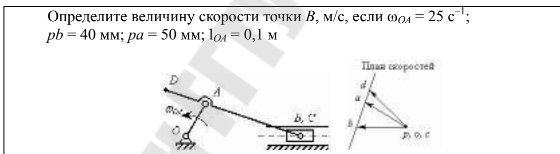
Рис. 3. Пример тестового задания на правильность перехода от числовых значений к графическим построениям и от построенного плана скоростей к числовому значению скорости

Для исключения этой проблемы была создана группа тестовых заданий, в которых графические построения являются частью условия тестового задания. Испытуемому предлагается использовать имеющиеся числовые данные, правильно их соотносить с графическими построениями, как при переходе от числовых значений к графическим построениям, так и при переходе от построенного плана скоростей к числовому значению скорости, которую требуется определить в тестовом задании.