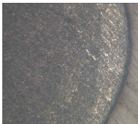
Рис. 2. Поперечное сечение проволоки, ТО – высокий отпуск, ликвация углерода по сечению, x150

Структура после среднего отпуска характеризуется еще большим уменьшением межпластинчатого расстояния, которое составило в среднем 0,7 мкм. Высокая дисперсность структуры приводит к увеличению прочностных свойств (таблица) и снижению пластичности.