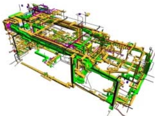
Рис. 3. Комплекс инженерного оборудования

В отличие от традиционных систем компьютерного проектирования, результатом информационного моделирования здания обычно является объектно-ориентированная цифровая модель как всего объекта, так и процесса его строительства.