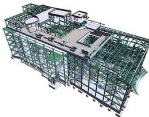
Рис. 2. Несущий каркас здания