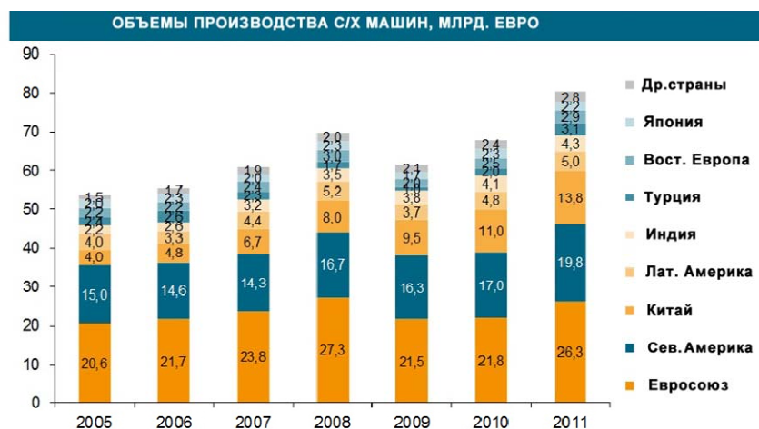
Рис. 1. Динамика мирового производства сельхозтехники

Динамика мирового производства сельхозтехники (в % от денежного исчисления в млрд евро) выглядит так на октябрь 2012 г.