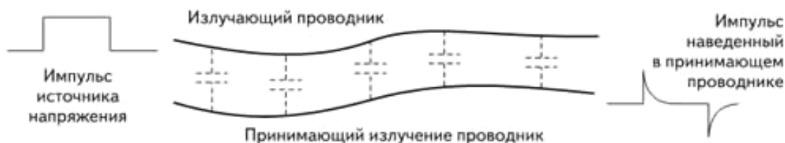
Рис. 2. Емкостные наводки на принимающий проводник

В действительности заземление экрана контрольного кабеля с одной стороны является эффективным лишь против емкостных наводок (рис. 2) (так называемая электростатическая защита) и совершенно неэффективной мерой (коэффициент ослабления помехи k = 1 ) для индуктированных наводок, поскольку этот экран не обеспечивает цепи для замыкания тока помехи. При заземлении экрана с двух сторон появляется дополнительная цепь (экран), обладающая значительно меньшим импедансом для высокочастотного сигнала, чем «земля».