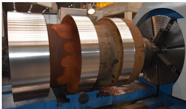
Рис. 1. Переточка валка с ящичным калибром клетки № 1 стана 370/150 ОАО «БМЗ»

Ящичные калибры обладают высокой захватывающей и деформирующей способностью, обеспечивают отличную устойчивость полосы в калибре без нагрузки на привалковую арматуру. Наиболее эффективно их применение при прокатке высоких полос с большими и средними сечениями. Основные недостатки – большая глубина вреза и термоциклическое разрушение выпусков калибров. Высота и угол выпуска определяется условием устойчивости полосы в калибре и обеспечением 4-точечного захвата выпусками. Определение оптимальной высоты выпуска ящичных калибров для клетей № 1–3 стана 370/150 СПЦ-2 ОАО «БМЗ» – цель этой работы.