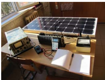
Рис. 1. Исследуемый лабораторный стенд