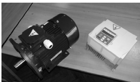
Рис. 1. Внешний вид ВИП-2.5

Одним из вариантов ВИП является семейство вентильно-индукторных электроприводов производства ООО «Сапфир» (Россия, г. Ростов-на-Дону). На рис. 1 представлен привод ВИП-2.5.