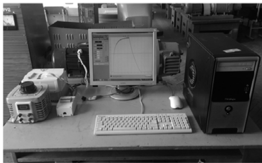
Рис. 3. Экспериментальная установка

Для исследования данного ВИП было проведено дипломное проектирование по разработке лабораторного комплекса. Данный комплекс позиционируется как площадка для изучения ВИП в рамках лабораторных работ и проведения научных исследований (рис. 3).