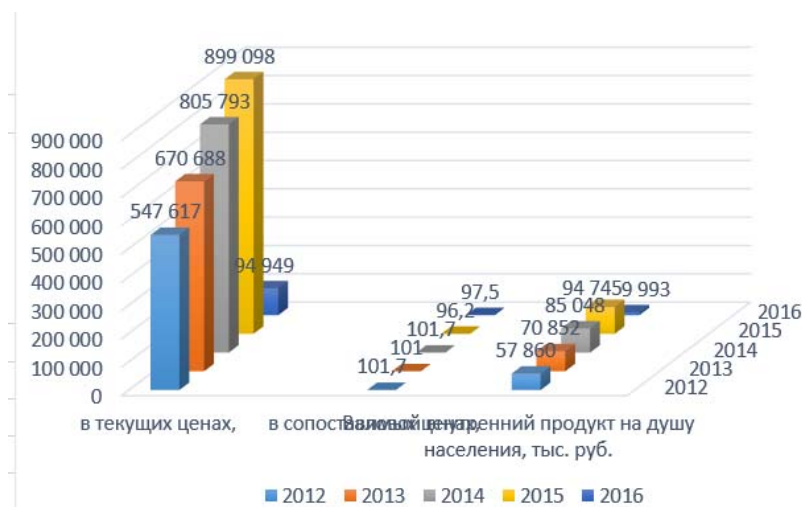
Рис. 2. Динамика ВВП Республики Беларусь 2012–2016 гг.

Для анализа влияния инфляции на экономическое состояние страны необходимо сравнить темпы инфляции и роста ВВП. На протяжении последнего десятилетия темпы инфляции в стране, в основном, превышали темпы роста ВВП, что отрицательно влияло на качество экономического роста и являлось источником рисков макроэкономической нестабильности. По мнению многих экспертов, правительству необходимо сделать выбор: либо поддержание высоких темпов экономического роста и увеличение инфляционного потенциала, либо сдерживание инфляции и очень умеренный экономический рост [4].